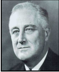
Franklin Delano Roosevelt (January 30, 1882 – April 12, 1945),

உலகத்தின் பெருமக்களான அநேகரின் சரித்திரத்தை நான் வாசித்திருக்கிறேன். அதிலே அமெரிக்க நாட்டின் குடியரசு தலைவராக இருந்த ரூஸ்வெல்ட், இன்றைக்கு அமெரிக்கர்களின் உள்ளத்தை கவர்ந்தவர்.